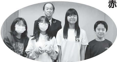
赤平小学校児童会