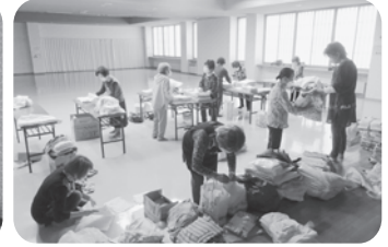
老人クラブ連合会