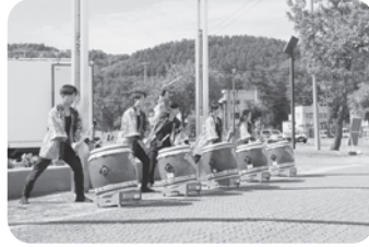
赤平火太鼓保存会